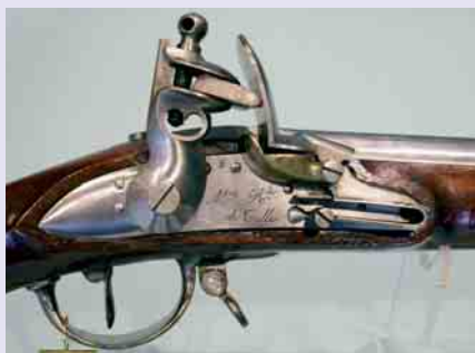
Platine à silex d'un fusil de Grenadier - Modèle 1816 - Fabriqué en 1821 - Manufacture Royale de Tulle - Collection musée des Armes - Tulle

Lawrence LAMY, Conservateur du Patrimoine