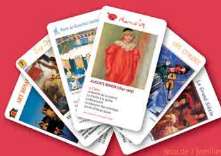
Jeux de Familles

Jeux sur l'art et l'histoire qui permettent aux enfants (et aux parents !) d'apprendre et de se cultiver tout en s'amusant beaucoup. Présentés dans des coffrets vernis, avec des LIVRETS EXPLICATIFS qui racontent plein d'anecdotes et d'histoires amusantes sur chaque illustration. Deux références existent aussi en version anglaise.