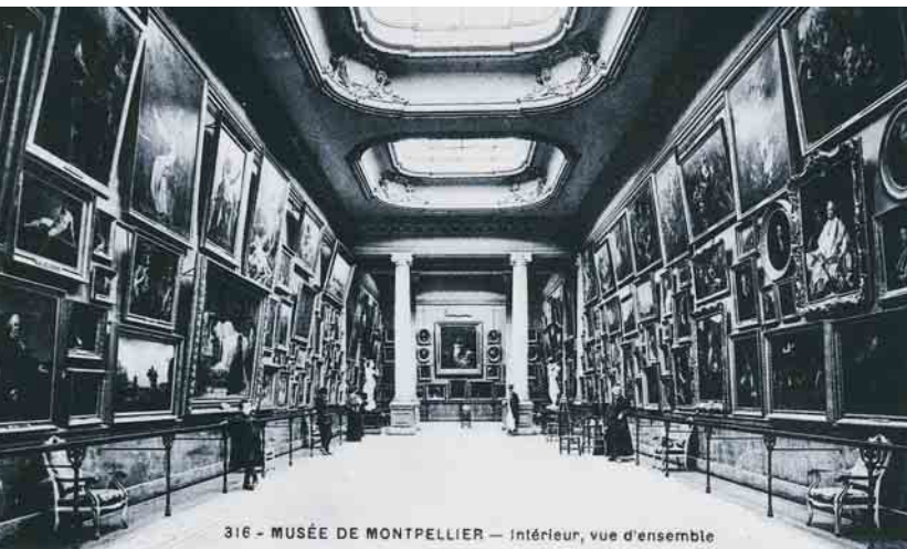
316 - MUSÉE DE MONTPELLIER — Intérieur, vue d'ensemble