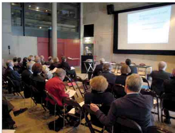
27 mars 2007 - réunion nordique à Stockholm : présentation du programme "Etats de la Baltique"