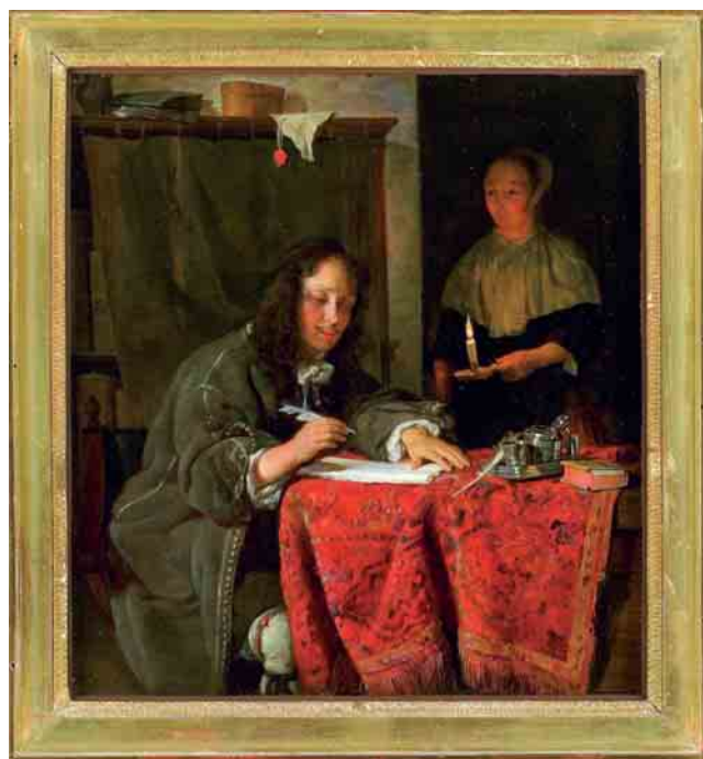
Metsu, Jeune homme écrivant