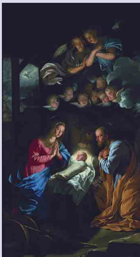
Philippe de Champaigne La Nativité , 1643. Palais des Beaux-Arts de Lille

La mise en place de tous ces projets destinés à informer et à approcher de nombreux et nouveaux publics nous a permis de devenir partenaire d'une grande opération médiatique autour d'une exposition majeure.