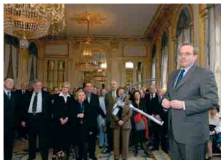
Discours du Ministre de la Culture et de la Communication