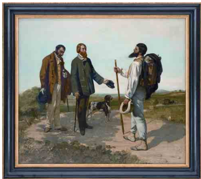
Courbet "La Rencontre"

On quitte la salle Courbet par un couloir et l'on arrive à deux autres salles de façade : la première est consacrée à Bazille et à ses amis impressionnistes, avec notamment le Portrait de Bazille peignant Le héron par Renoir et le Portrait de Renoir par Bazille (dépôts du Musée d'Orsay). C'est une salle très spectaculaire avec tous les tableaux de Bazille déjà détenus par le musée et avec, bien sûr, les dernières acquisitions. Ces chefs-d'œuvre - beaucoup de toiles connues et d'autres qui le sont moins - permettent de mettre en perspective les prémices de l'impressionnisme que des tableaux montrent sous différentes facettes : Manet, Berthe Morisot, Guillaumin, Lebourg et Degas. Quant à la grande salle qui suit, elle est consacrée à la couleur, avec des tableaux que le musée possédait déjà : Van Dongen (avec des dépôts pour ce même peintre), mais aussi des tableaux des Fauves, de Delaunay, de Camoin, de Gontcharova qui, grâce encore à des dépôts, sont venus enrichir cette salle.