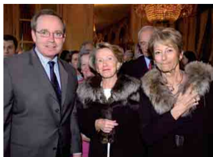
Le Ministre avec les Amies du Musée Matisse à Nice