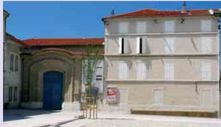
Vue du musée actuel

Le nouveau musée qui aura presque doublé sa surface permettra une meilleure présentation des œuvres et la création des équipements culturels et scientifiques tels que espaces d'expositions temporaires, ateliers de montage, salle de confé-