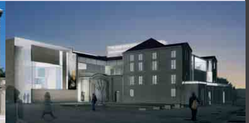
Vue du projet