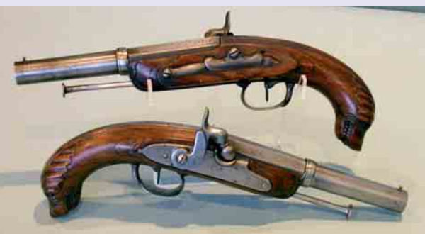
Paire de pistolets à silex d'Officier de Marine - Transformé à percussion - Modèle 1779 - Signé Chauveur à Tulle Manufacture d'Armes de Tulle - Collection musée des Armes - Tulle

Le musée des Armes actuel a été créé en 1979 par le personnel de la Manufacture Nationale d'Armes de Tulle.