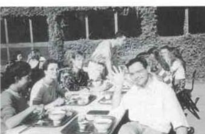
Petit déjeuner ensoleillé à l'internat montpelliéren

Comment les convaincre de franchir le seuil d'une institution culturelle si ce n'est que par une promesse de plaisir ?