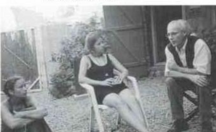
Conversation avec le peintre J. Blanchet au seuil de son atelier