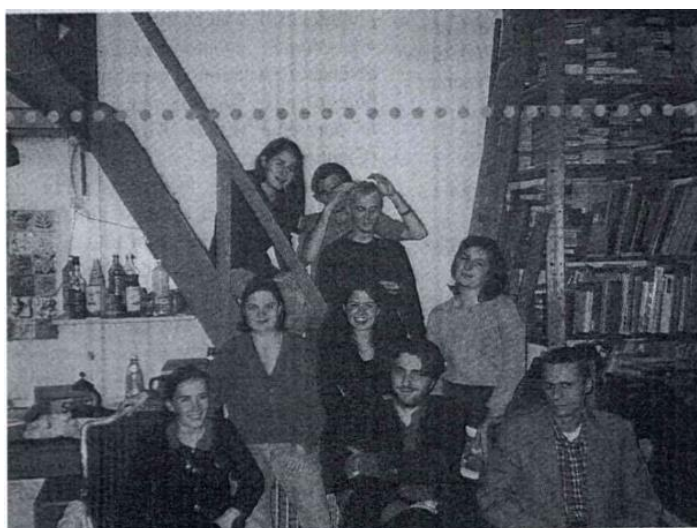
Groupement des Associations des Jeunes Amis de Musées

En 1998, le GAJAM, dont les membres ne sont pas adhérents à une société d'amis, est rattaché au secrétariat de la FFSAM. Dans une optique d'orientation des sections JAM, le GAJAM rédige une charte éthique s'inspirant très largement de celle adoptée en octobre 1996 à Oaxaca (Mexique), lors du IXe congrès international de la Fédération mondiale des amis de musées (FMAM). Cette charte vise à apporter une légitimité aux sections JAM, à leur offrir un cadre d'action, à leur faire prendre conscience de leurs devoirs à l'égard de l'institution et à faire reconnaître leur contribution.