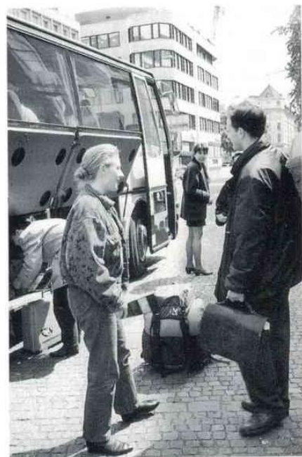
C'est la fin du voyage!

Ω 22-27 aout 1993 : A l'invitation de la FFSAM, 2 ème voyage d'été de formation à l'art contemporain pour tous les JAM de France et d'Europe, conçu par le FRAC des Pays de la Loire. Objectif « Apprendre à regarder ».