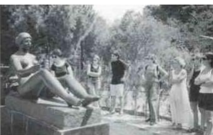
Sculpture de Maillol

Ω 1-6 juillet 1994 : 3 ème voyage d'été des JAM de formation à l'art contemporain dans les Pays de la Loire : renouvellement de l'invitation à participer à la découverte de la création artistique actuelle en suivant le parcours des « Images du plaisir ». S'adresse à des plus 18 ans.