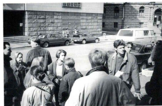
Sortie du Musée de Berne

Afin d'y parvenir, les membres de l'association font circuler un questionnaire auprès des CDI des lycées et par l'entremise de certains professeurs pour les autres établissements. Le questionnaire est rédigé de manière à connaître les attentes des jeunes afin de leur proposer des activités adaptées à leurs préoccupations et leurs recherches sur l'art.